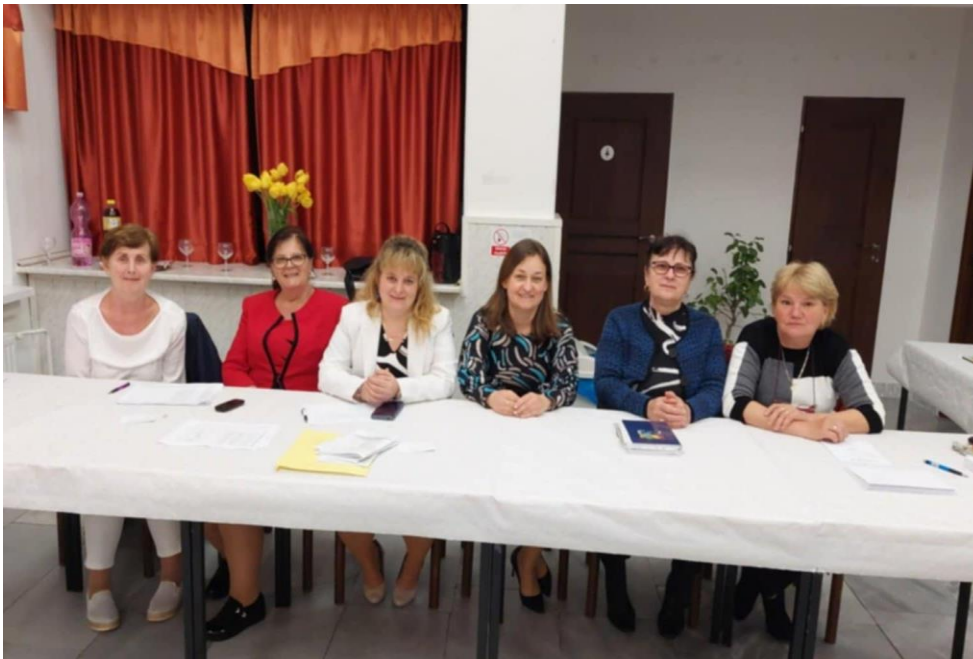
A választási bizottság tagjai

2024. június 8-án az Európai Parlamentbe választottunk képviselőket. Medvén a választópolgárok 31,22 százaléka élt szavazati jogával, 148 választó járult az urnához, ebből 2 szavazat érvénytelen volt. Községünkben leadott szavazatok alapján a legtöbb voksot Magyar Szövetség-Maďarská aliancia-97 kapta, ezt követte a SMER-Sociálna demokracia-13, REPUBLIKA-11, Demokrati-9, Progresívne Slovensko-9, HLAS-Sociálna demokracia-3, KDĤ-2, Sloboda a Solidarita-1, SLOVENSKO, ZA ĽUDÍ-1. Szlovákiában a Progresszív Szlovákia nyert, 27,81 százalékkal.